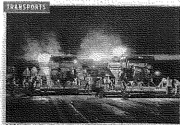
À B. à hauteur de Lissy (Seine-et-Marne), le 25 août 2012. Jusqu'en décembre, les travaux de réfection de l'A63 concernent 50 km en Seine-et-Marne, de Vitry-le-François à Vitry-le-François, en direction de Vitry-le-François.