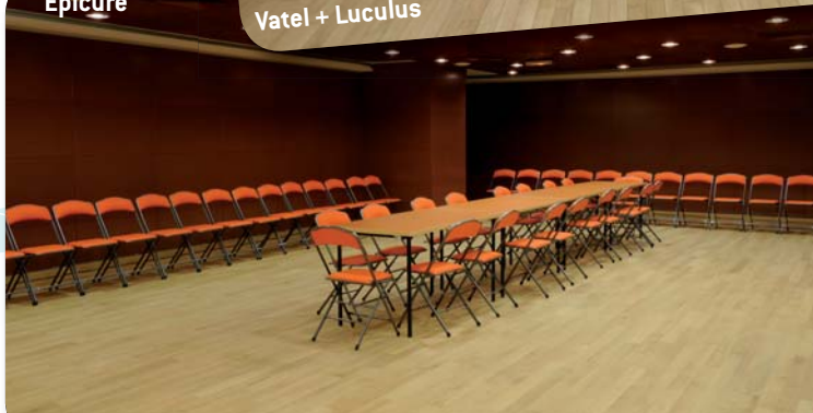
Vatel + Lucullus