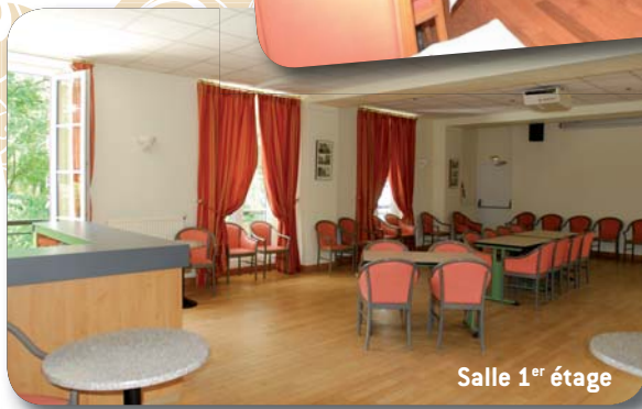
Salle 1 er étage